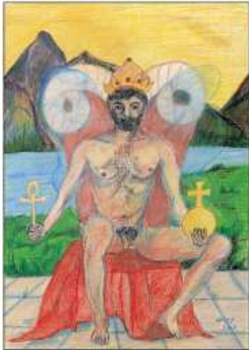
IV. De Keizer