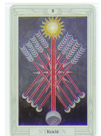
S I Kracht N

De acht pijlen van de ziel in het harmonische rooster in de Staven 9 van het Thot deck zijn in Staven 10 veranderd in levendige roodwitblauwe vlamme staven van verrassende impulsen. De oranjekeurig achtergrond wijst op vurige energie. De witte vlammen achter de staven waaieren alle kanten uit. De eendrachtige donderbeitels van Staven 2 zijn hier echter omgesmeed tot machtige tralies, jouw schaduw die op wacht staat om al die doorleefde en levendige energie gevangen te houden. De bliksem moet erin om beide dorjé's weer te verenigen zodat de onderdrukte energie opnieuw vrij kan stromen.